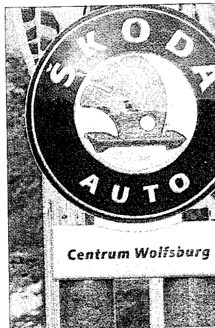
Le moral des chefs d'entreprise en

Mais «une évaluation des réponses apportées avant et après le vote a montré une tendance (de la part des entrepreneurs) à donner des réponses plus défavorables après les élections», a expliqué le président de l'institut,